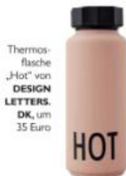
Thermos- flasche „Hot“ von DESIGN LETTERS. DK , um 35 Euro