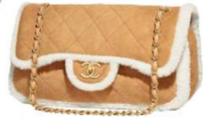
Tasche aus Lammfell, von CHANEL , um 4.300 Euro