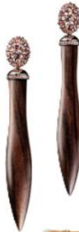
Ohrhänger „Excalbur“ aus Ebenholz, mit Saphiren, von JUWELENSCHMIEDE THOMAS JIRGENS , um 22.500 Euro