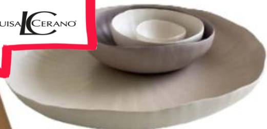
Keramikschalen aus der „Flower“-Serie von RINA MENARDI , von 40 bis 360 Euro