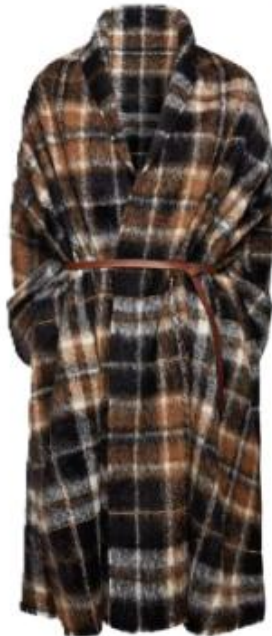
Mantel aus Alpaka und Wolle, von BRUNELLO CUCINELLI , um 4.990 Euro