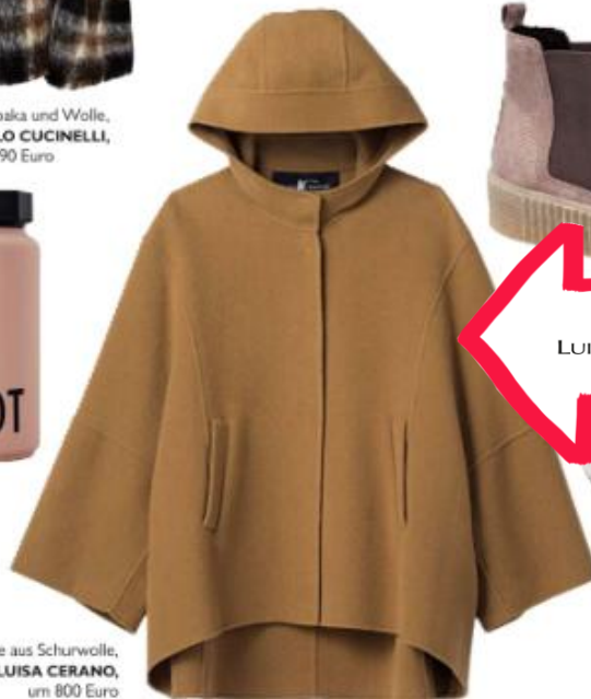
Cape aus Schurwolle, von LUISA CERANO , um 800 Euro