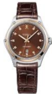
Uhr „Discovery“ mit Diamanten, von EBEL , um 2.400 Euro