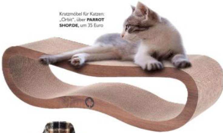
Kratzmöbel für Katzen: „Orbit“, über PARROT SHOP.DE , um 35 Euro