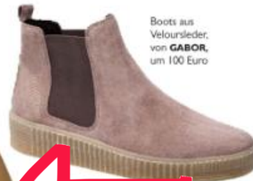
Boots aus Veloursleder, von GABOR , um 100 Euro