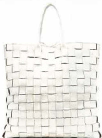
XL-Shopper aus geflochtenem Nappaleder, von Bottega Veneta, um 7500 Euro