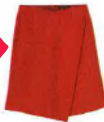
Minirock von LUISA CERANO, um 270 €