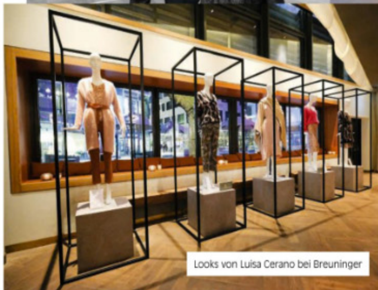
Looks von Luisa Cerano bei Breuninger