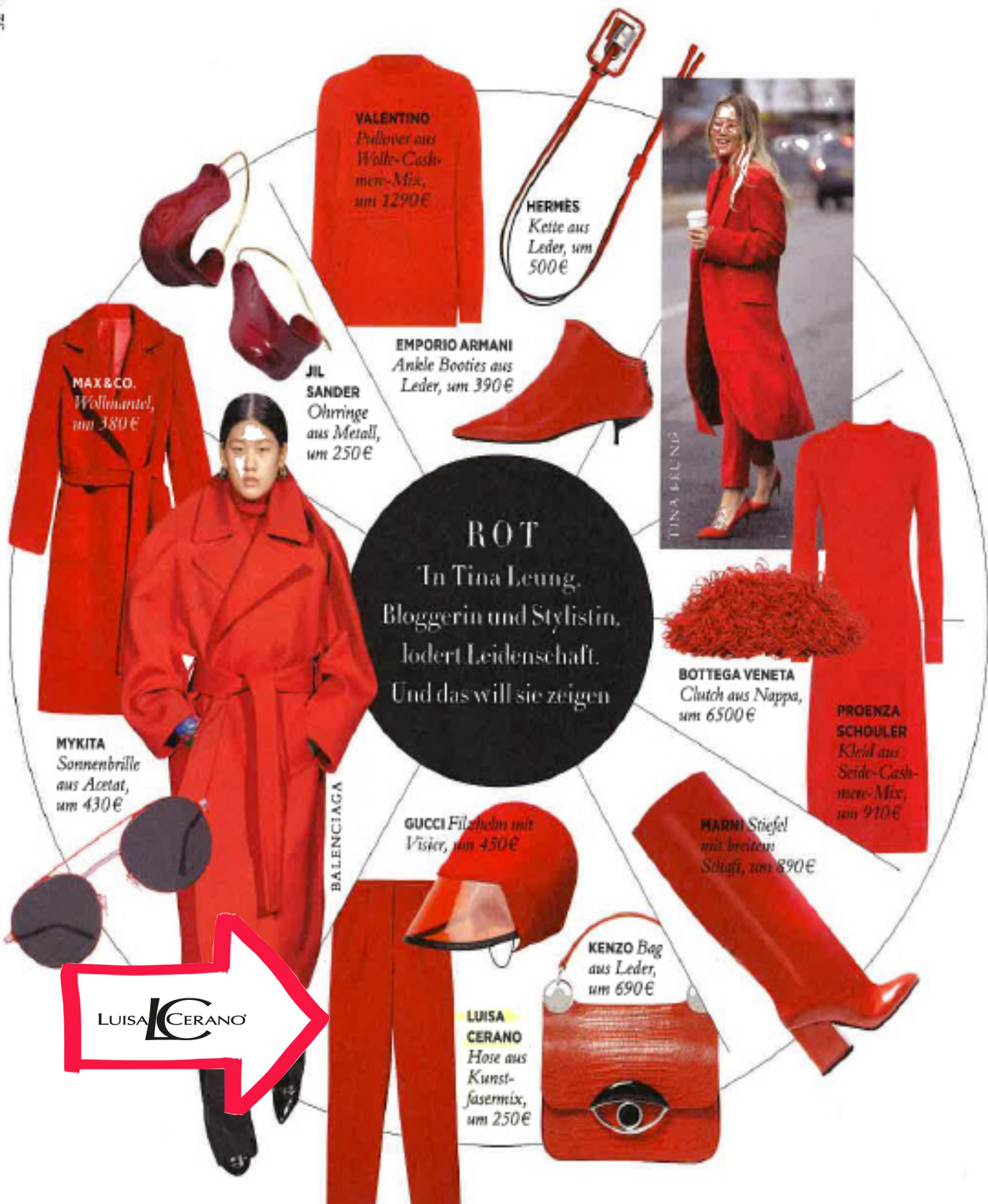
VALENTINO Pullover aus Wolle-Cash- mere-Mix, um 1290€