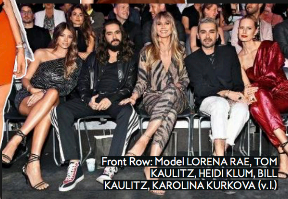
Front Row: Model LORENA RAE, TOM KAULITZ, HEIDI KLUM, BILL KAULITZ, KAROLINA KURKOVA (v.l.)