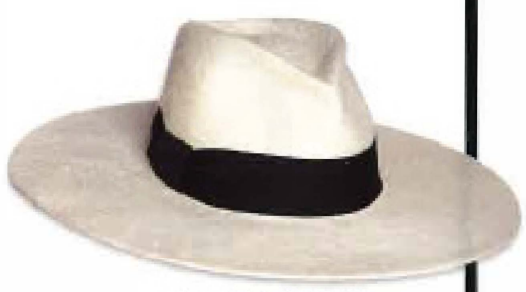
Hut mit breiter Krempe, aus Biberhaar, von Spatz Hutdesign, um 580 Euro