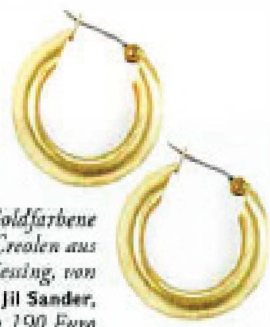
Goldfarbene Creolen aus Messing, von Jil Sander, um 190 Euro