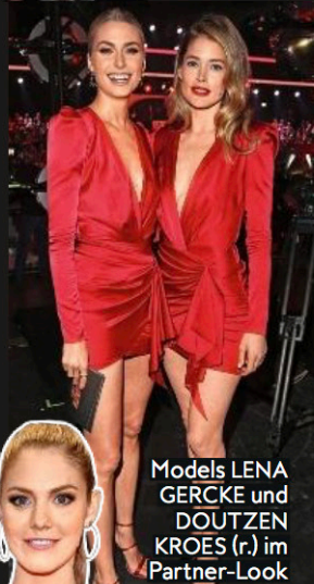
Models LENA GERCKE und DÖUTZEN KROES (r.) im Partner-Look