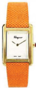
Uhr mit Lederarmband und weißem Zifferblatt, von Salvatore Ferragamo, um 770 Euro