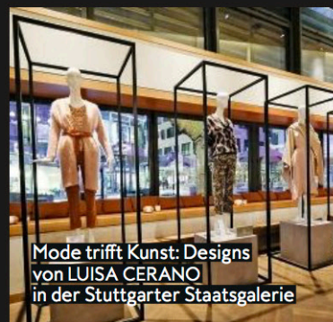
Mode trifft Kunst: Designs von LUISA CERANO in der Stuttgarter Staatsgalerie