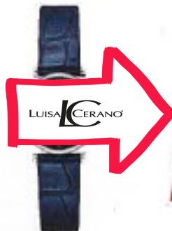
Edelstahl-Damenuhr „La Grande Classique“ von LONGINES, um 870 €