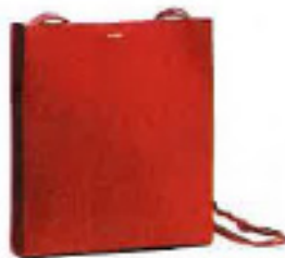
Kalbsledertasche „Tangle Bag“ von JIL SANDER, um 890 €