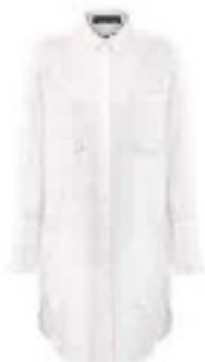
Lange Hemdbluse von STEFFEN SCHRAUT, um 170 €

+++ FARB-CODE: 5 FAVORITEN IM FRENCH CHIC +++